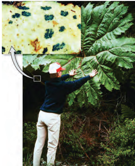
شکل ۶- الف) گیاه آبی آزولا، ب) گیاه گونرا