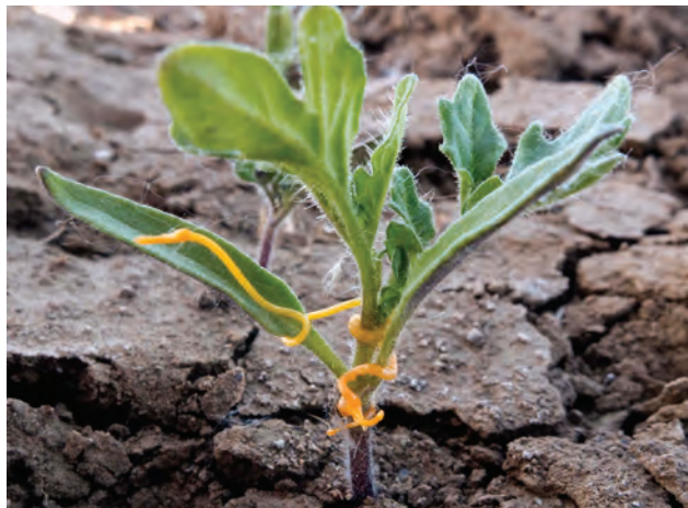
شکل ۹-گیاهان انگل: الف) گیاه سس