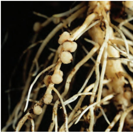
شکل ۵- گرهک های ریشه گیاهان تیره پروانه واران

گرهک، نوعی باکتری تثبیت کننده نیتروژن به نام ریزوبیوم زندگی می کند (شکل ۵). هنگامی که این گیاهان می میرند یا بخش های هوایی آنها برداشت می شود، گرهک های آنها در خاک باقی می ماند و گیاه خاک غنی از نیتروژن ایجاد می کنند. ریزوبیوم ها با تثبیت نیتروژن، نیاز گیاه را به این عنصر برطرف می کنند و گیاه نیز مواد آلی مورد نیاز باکتری را برای آن فراهم می کند.