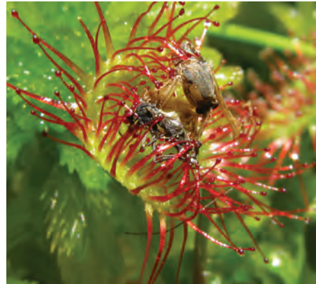
شکل ۸-چند نوع گیاه حشره‌خوار.

گیاهان انگل: انواعی از گیاهان انگل وجود دارند که همه یا بخشی از آب و مواد غذایی خود را از گیاهان فتوسنتزکننده دریافت می‌کنند. گیاه سس ، نمونه‌ای از این گیاهان است. این گیاه ساقه نازکی یا زردرنگی تولید می‌کند که فاقد ریشه است. گیاه سس به دور گیاه سبز میزبان خود می‌پیچد و اندام‌های مکنده ایجاد می‌کند (شکل ۹-الف) که به درون آوندهای گیاه نفوذ، و مواد مورد نیاز انگل را جذب می‌کند. گل جالیز نمونه دیگری از این گیاهان است که با ایجاد اندام مکنده و نفوذ آن به ریشه گیاهان جالیزی، مواد مغذی را دریافت می‌کند (شکل ۹-ب).