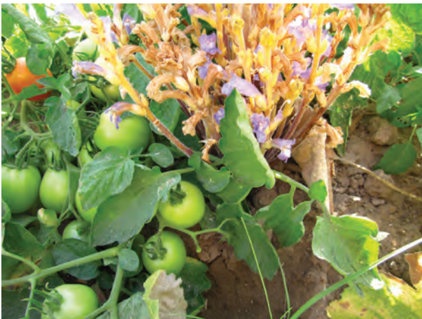
ب) گیاه گل جالیز در کنار بوته گوجه‌فرنگی

گیاهان انگل: انواعی از گیاهان انگل وجود دارند که همه یا بخشی از آب و مواد غذایی خود را از گیاهان فتوسنتزکننده دریافت می‌کنند. گیاه سس ، نمونه‌ای از این گیاهان است. این گیاه ساقه نازکی یا زردرنگی تولید می‌کند که فاقد ریشه است. گیاه سس به دور گیاه سبز میزبان خود می‌پیچد و اندام‌های مکنده ایجاد می‌کند (شکل ۹-الف) که به درون آوندهای گیاه نفوذ، و مواد مورد نیاز انگل را جذب می‌کند. گل جالیز نمونه دیگری از این گیاهان است که با ایجاد اندام مکنده و نفوذ آن به ریشه گیاهان جالیزی، مواد مغذی را دریافت می‌کند (شکل ۹-ب).