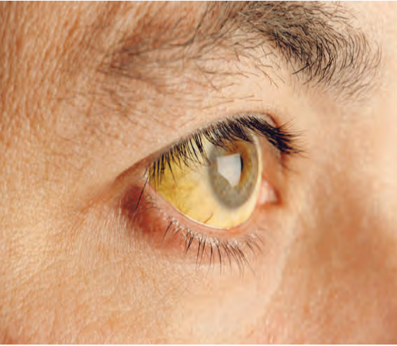
شکل ۲. بیماری هپاتیت با علائمی به صورت بروز زردی بروز می‌کند.

بیماری هپاتیت «B» از یک سو می‌تواند بدون علامت باشد و از سوی دیگر می‌تواند علائم بسیار شدید همراه با درگیری شدید کبدی ایجاد نماید. به‌طور معمول بعد از ورود ویروس به بدن فرد و پس از یک دوره بدون علامت، علائمی مانند سرماخوردگی مثل ضعف، کسالت، بی‌اشتهایی، تب، خستگی، درد عضلات، التهاب مفاصل و عوارض پوستی در فرد ایجاد می‌شود.